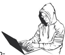
Схема заключается в том, что пользователь получает в мессенджере сообщение от хорошего знакомого с просьбой проголосовать в каком-то конкурсе, где для победы не хватает пары оценок. Казалось бы, что тут опасного?! Чтобы поддержать близкого человека, нужно лишь перейти по ссылке и сообщить код.

Прокуратура Ленинградской области предупреждает о новом коварном виде мошенничества.