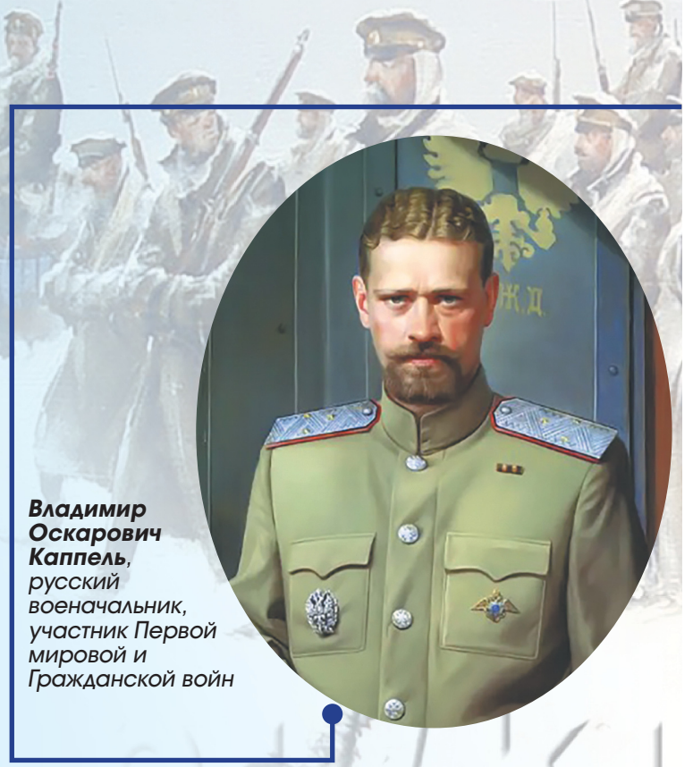
Владимир Оskarович Каппель, русский военачальник, участник Первой мировой и Гражданской войн

Белогвардейцы попытались дать бой, но были разбиты. В живых остались, по разным подсчетам, от 12 до 20 тысяч человек. Так под Красноярском рухнула последняя надежда возобновить дальнейшую борьбу. Этим и закончился первый этап Ледяного Сибирского похода.