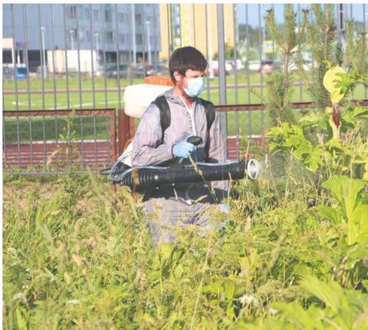
Химическая обработка муниципальных территорий от борщевика Сосновского проводится два раза в год

Основным мероприятием в рамках формирования комфортной городской среды станет благоустройство парка «Косая гора» в Кудрово по федеральной программе. Общественное пространство появится между Цен-