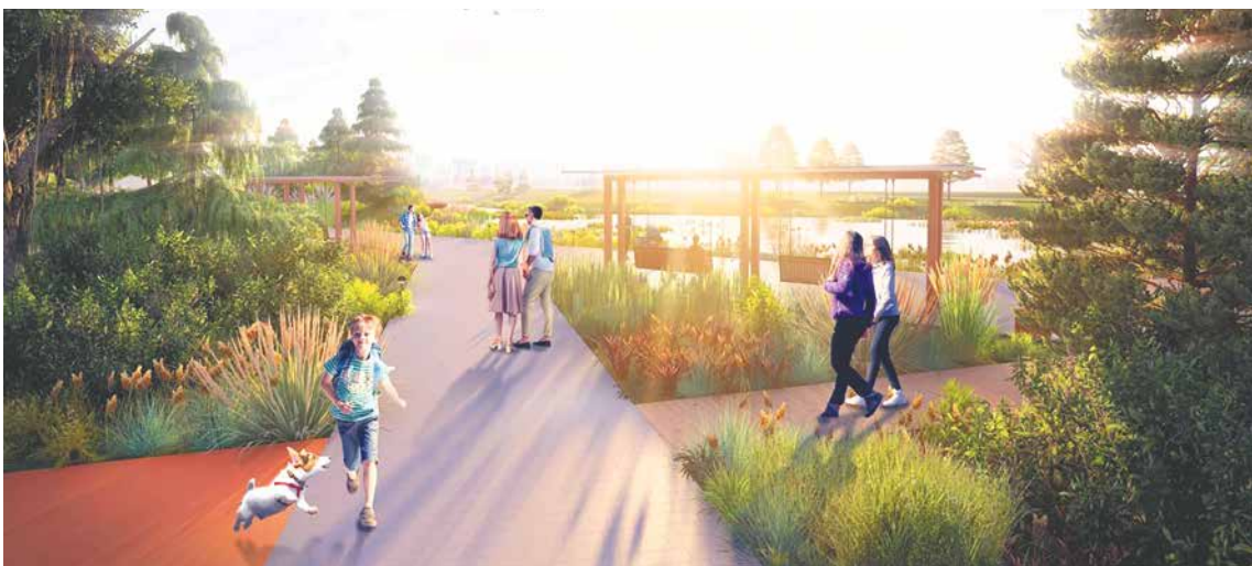
В Кудрово между Центральной и ж/д переездом на Новой улице появится новый парк «Косая гора»

Продолжится работа по вовлечению подрастающего поколения в общественную жизнь МО, в том числе по-прежнему будут функционировать и совершенствоваться муниципальные молодежные трудовые бригады и губернаторский трудотряд, волонтерский штаб и молодежный совет. Ребята смогут принять участие в различных патриотических, экологических, благотворительных, творческих и спортивных мероприятиях.