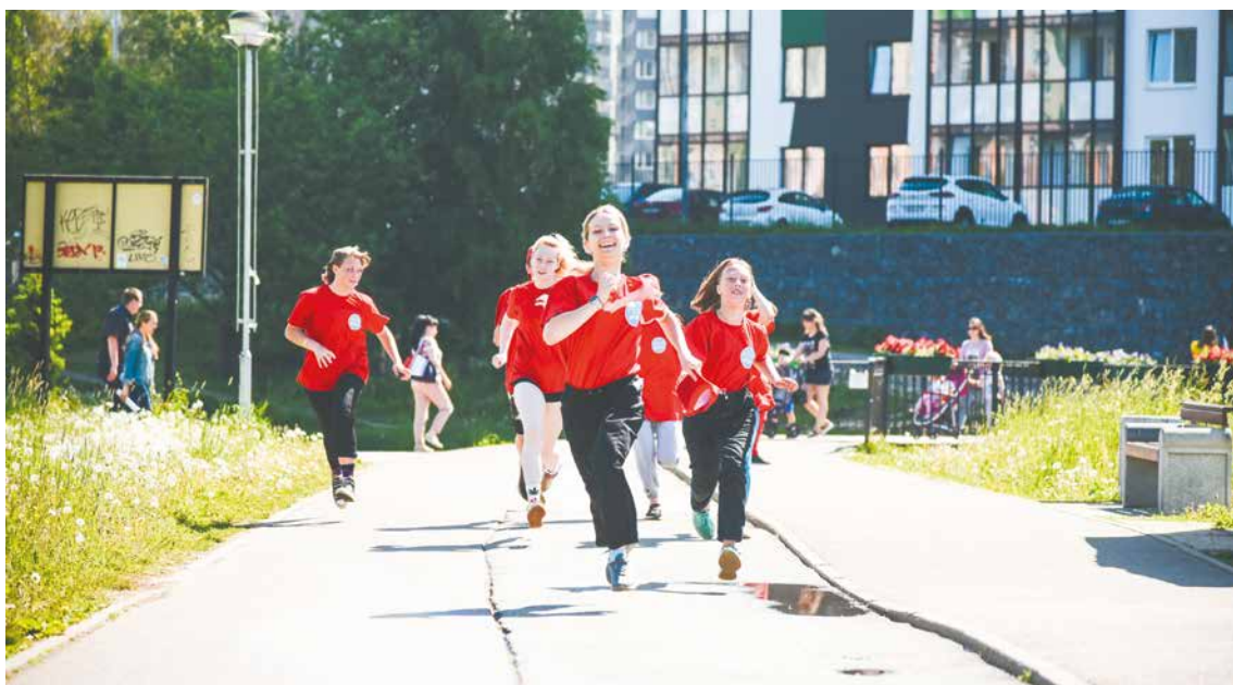
Губернаторские и муниципальные молодежные трудовые бригады на летних каникулах не только занимаются благоустройством малой родины, но и участвуют в спортивных и культурных мероприятиях

содержания автомобильных дорог. В рамках благоустройства средства, в частности, пойдут на уборку территорий. Напомним, подрядчик ежедневно на-