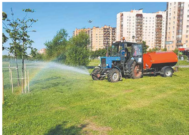
Уборка улиц в муниципальном образовании ведется каждый день

фортно тренироваться даже зимой, а еще на площадке появится стационарная сцена для выступлений местных и приглашенных артистов. В тот же период приступят к проектированию дома культуры для городского поселка на Новой улице. Возле учреждения будет сквер с зелеными насаждениями и лавочками. А чтобы решить проблему с постоянной наводненностью территории, сделают дренаж. В 2024-м выполнят капитальный ремонт футбольного мини-стадиона в Заневке у дома № 50 и много-