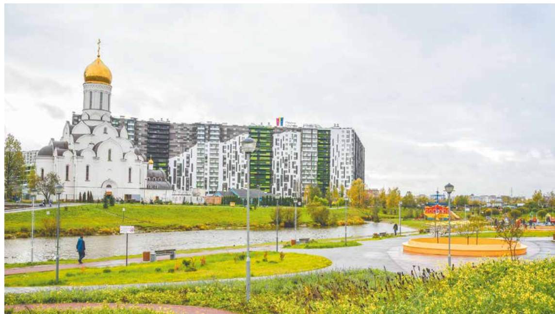
Благоустройство парка «Оккервиль» по программе «Комфортная городская среда» вошло в реестр лучших практик Минстроя РФ

Не менее существенной считается программа по обеспечению устойчивого комплексного развития территории муниципального образования. Ее цель – обновление градостроительной документации и проведение кадастровых работ. Сейчас в поселении созданы топографические карты масштаба 1:2000, которые охватывают 100 % МО. Есть цифровые крупномасштабные планы населенных пунктов, содержащие в том числе информацию по подземным коммуникациям. Однако отсутствует единая система управления территориями. Специалисты сектора архитектуры и землеустройства предлагают собрать все сведения об объектах движимого и недвижимого имущества в один документ. Это позволит гораздо эффективнее следить за тем, как собственники земельных участков соблюдают утвержденные градостроительные регламенты, экологические и санитарно-эпидемиологические нормы и правила. Кроме того, в 2022-м предстоит актуализировать генплан, публичные слушания по которому состоятся в ноябре текущего года.