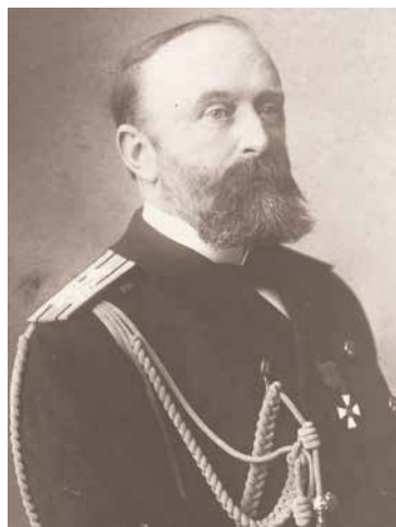
Капитан 1-го ранга Всеволод Руднев, командир крейсера «Варяг»

Следует сказать, что к началу XX века на этих территориях столкнулись интересы Японии