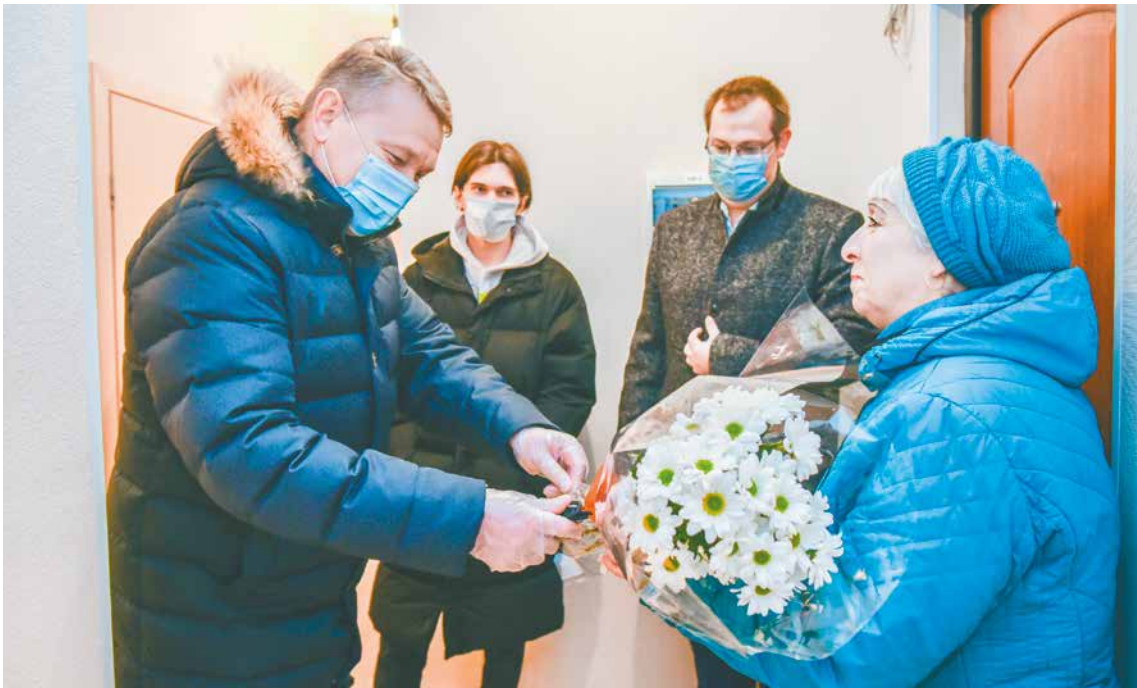
В Заневском поселении расселен весь муниципальный аварийный фонд