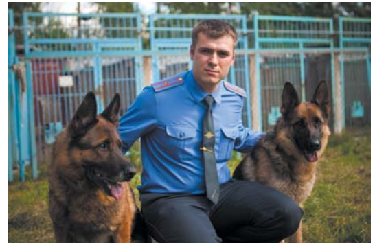
в деревне Янино-1 на улице Новая, дом 20.

Традиции первого в России питомника служебно-розыскного собаководства, созданного в Санкт-Петербурге в 1909 году, сегодня продолжает Зональный центр кинологовической службы ГУ МВД России по г. Санкт-Петербургу и Ленинградской области, расположенный