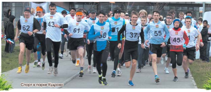
Спорт в парке Кудрово