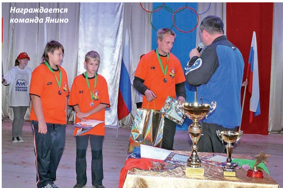
Награждается команда Янино