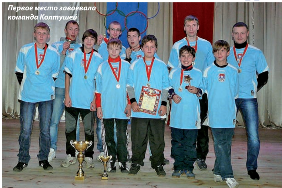
Первое место завоевала команда Колтушей

- Дорогие друзья! Я рад приветствовать вас в Заневском сельском поселении. Мне тоже удалось сегодня выступить в соревнованиях по стрельбе за сборную деревни Заневка. Пусть наша команда и не заняла призовых мест, но самое главное для массового спорта - не победа, а участие. Я хочу поблагодарить всех участников, но особенно взрослых - вы показываете хороший пример детям, увле-