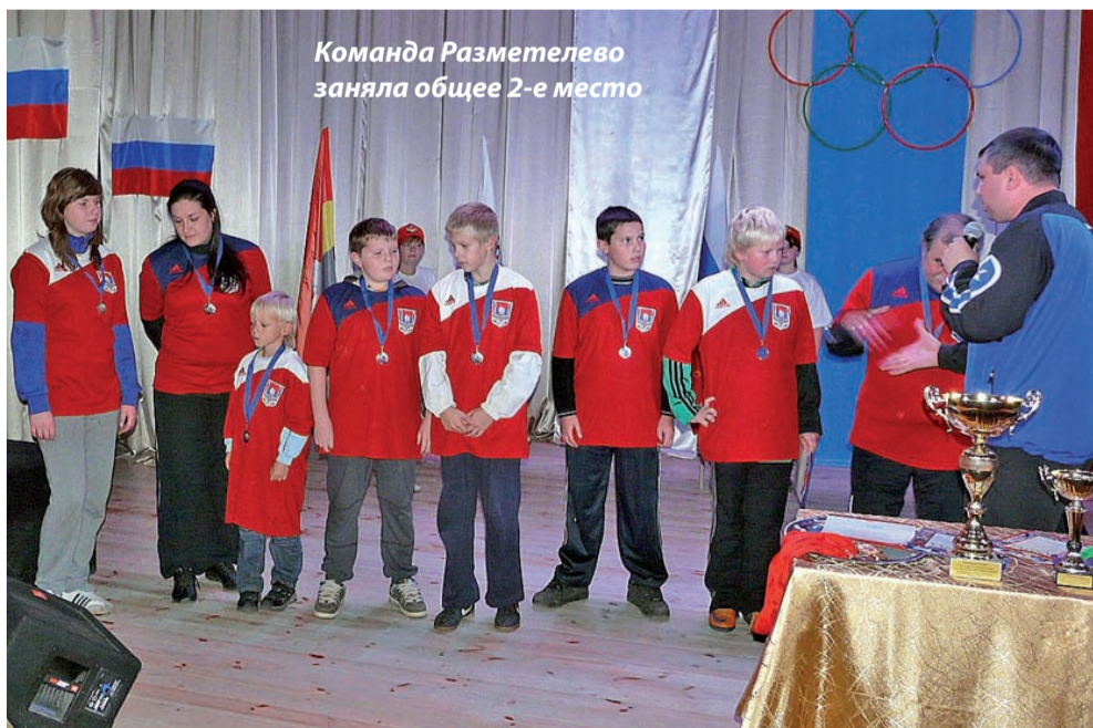
Команда Разметелево заняла общее 2-е место

Первая Открытая летняя спартакиада сельских поселений завершилась. Подведены итоги, победители и участники награждены. С наступлением морозов планируется провести первую зимнюю спартакиаду по следующим видам спорта: футбол на снегу, хоккей с мячом «на валенках» (на снегу), хоккей с мячом на льду, настольный теннис, лыжные гонки и, по многочисленным просьбам, стрельба из пневматической винтовки.