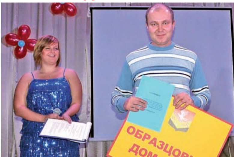
(Начало – стр. 1)

В церемонии награждения победителей конкурса на звание «Лучший дом», «Лучший подъезд» и «Лучший частный дом» МО «Заневское сельское поселение» в 2011 году приняли участие жители поселения, участни-