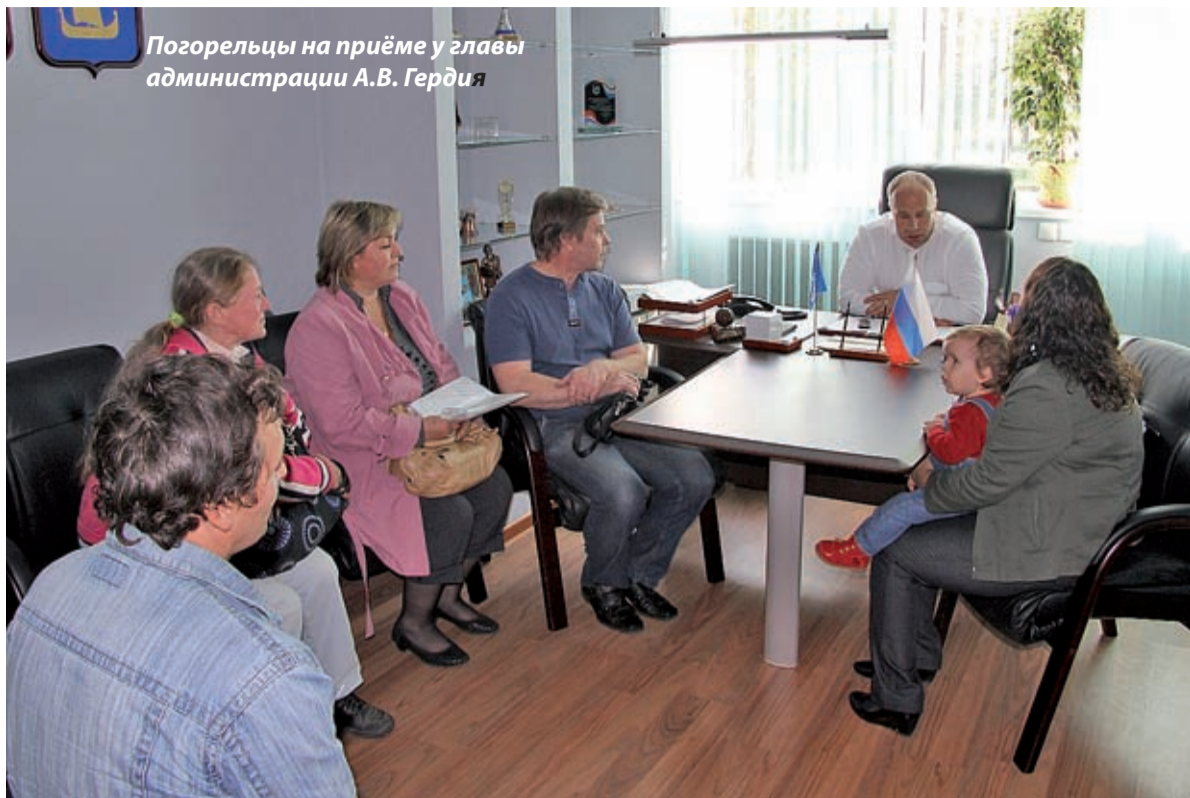
Погорельцы на приёме у главы администрации А.В. Гердия

него землю, чтобы постройся, - нам ведь теперь жить негде, - а он говорит: землю у меня нет – идите в муниципалитет!