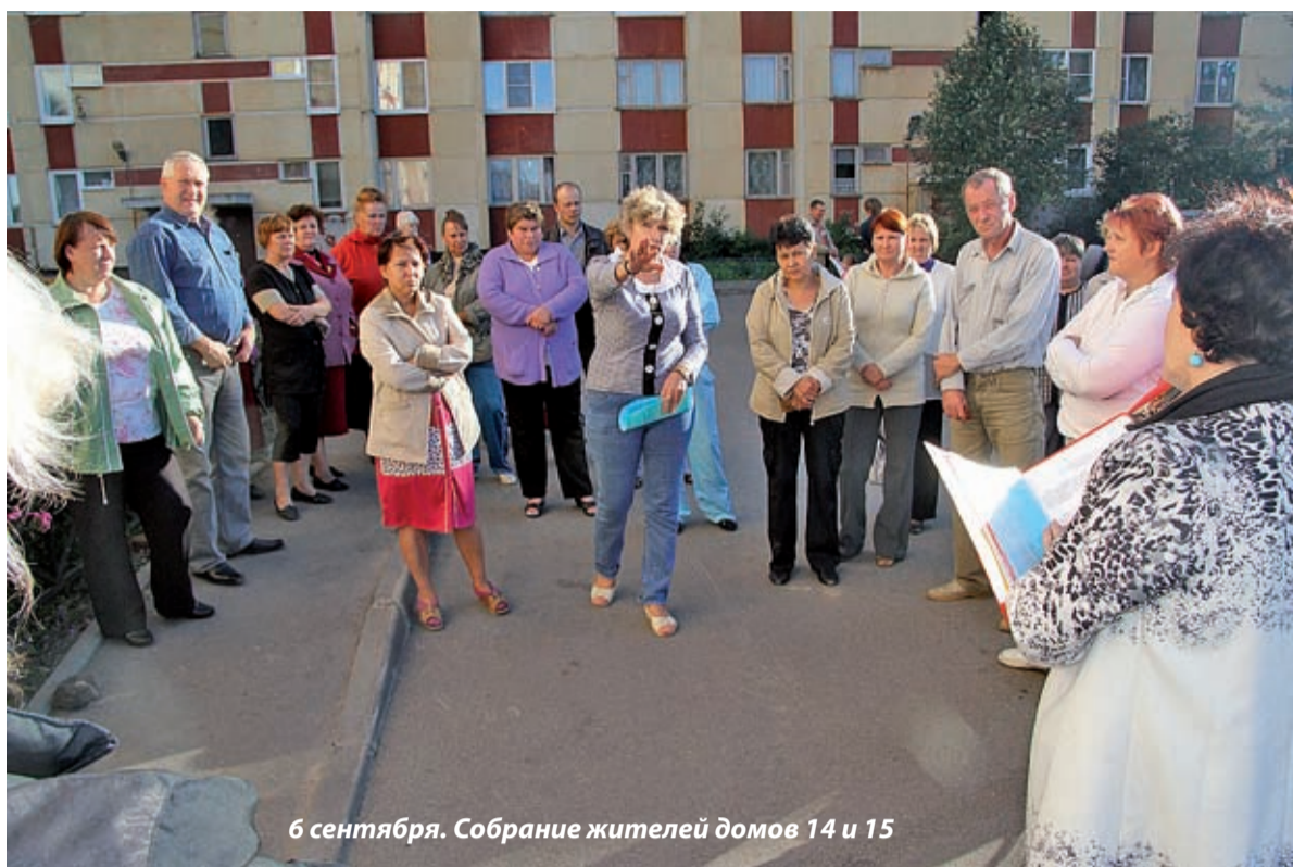
6 сентября. Собрание жителей домов 14 и 15

Следовательно, ООО «ПЖКЖ «Янино» имеет все законные