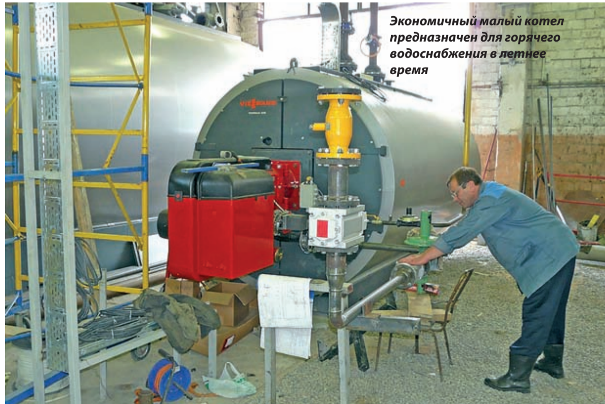
Экономичный малый котел предназначен для горячего водоснабжения в летнее время

Поселение строит и реконструирует водопроводы, в том числе и для частного сектора. Размах работ очень большой, но и потребности велики. Люди хотят жить с комфортом, и руководство поселения это понимает. Жители тоже стали лучше понимать полномочия и реальные возможности поселения. Они всё чаще становятся партнерами власти – помогают находить правильные решения. Для благоустройства жизни, особенно в частном секторе, предстоит сделать ещё очень много. Руководство поселения это знает и понимает лучше всех. Оно работает для этого планомерно и целеустремленно. Не все вопросы можно решить сразу, но то, что уже сделано в поселении, – впечатляет.