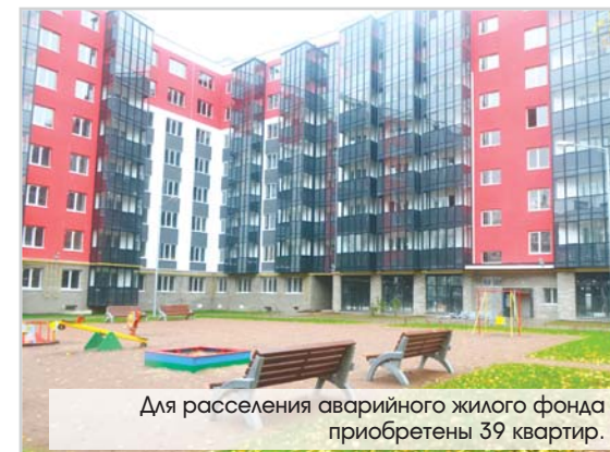
Для расселения аварийного жилого фонда приобретены 39 квартир.