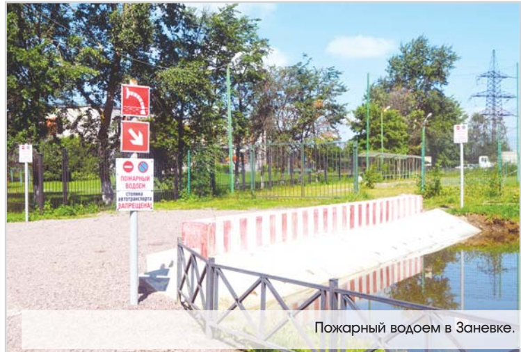
Пожарный водоем в Заневке.

В 2016 году администрация поселения делала особый упор на социальные нужды населения. Это проявлялось во всех сферах деятельности: от благоустройства до социальной защиты, от гражданской обороны до культуры. Многие цели за минувший год были достигнуты, но многое еще предстоит сделать. В целом работу администрации в 2016 году можно признать удовлетворительной.