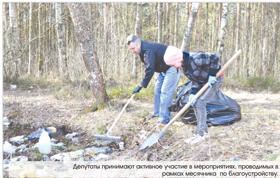
Депутаты принимают активное участие в мероприятиях, проводимых в рамках месячника по благоустройству.

Я уверен, что при поддержке руководства района и региона мы сумеем их решить и сделаем наше муниципальное образование более комфортным, уютным и привлекательным для проживания.