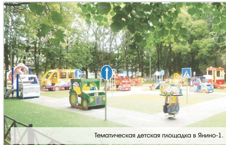
Тематическая детская площадка в Янино-1.

культуры нашего поселения удалось добиться лидерства во Всеволожском районе в КВНе. За 2016 год команда стала трижды лауреатами. Высоко оценена и работа студии вокала. Воспитанница КСДЦ заняла первое место в конкурсе «Лучший голос Всеволожского района». В декабре прошлого года хореографические студии «Изыюмка» и «Конфетти» заняли первые места в