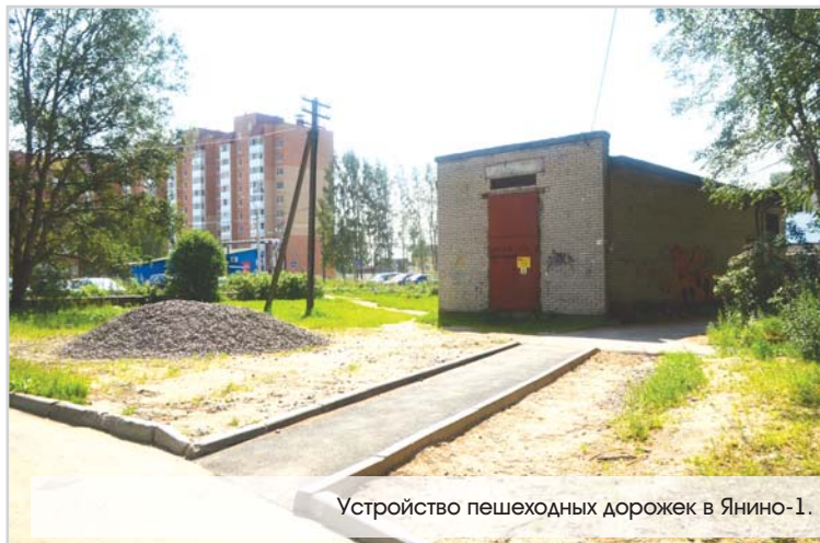
Устройство пешеходных дорожек в Янино-1.