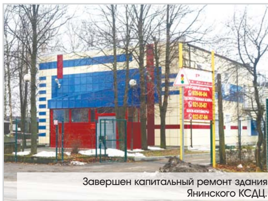
Завершен капитальный ремонт здания Янинского КСДЦ.