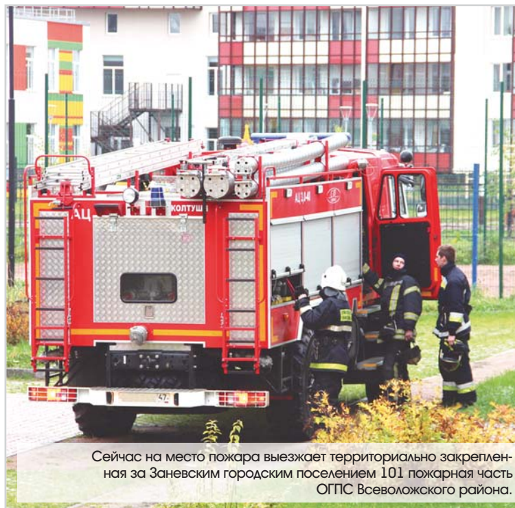
Сейчас на место пожара выезжает территориально закрепленная за Заневским городским поселением 101 пожарная часть ОПГПС Всеволожского района.