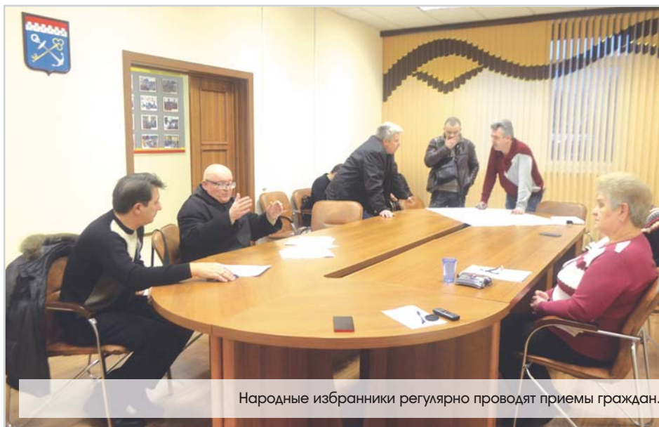
Народные избранники регулярно проводят приемы граждан.

После заседаний совета для обеспечения контроля и соответствия действующему законодательству все принятые решения направляются в прокуратуру района, а нормативно-правового характера – в государственный регистр. Это говорит о том, что при подготов-