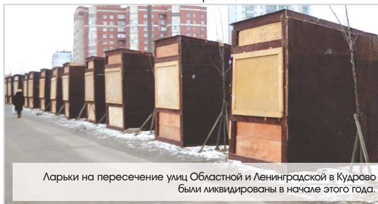
Ларьки на пересечение улиц Областной и Ленинградской в Кудрово были ликвидированы в начале этого года.

торговые павильоны расположены на территории, находящейся в собственности муниципального образования, или в случае, если государственная собственность не разграничена.