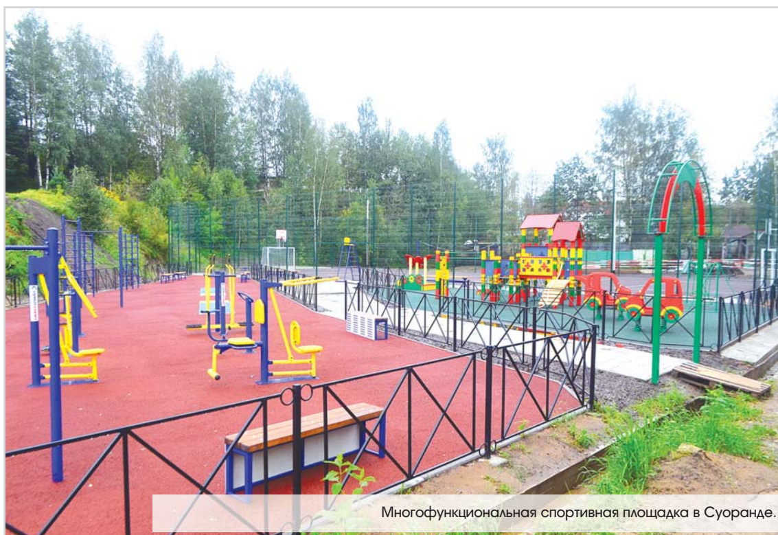
Многофункциональная спортивная площадка в Суоранде.

туаций. Это происходит путем передачи голосовых сообщений и звучания сирены, означающей основной сигнал гражданской обороны: «Внимание всем!».