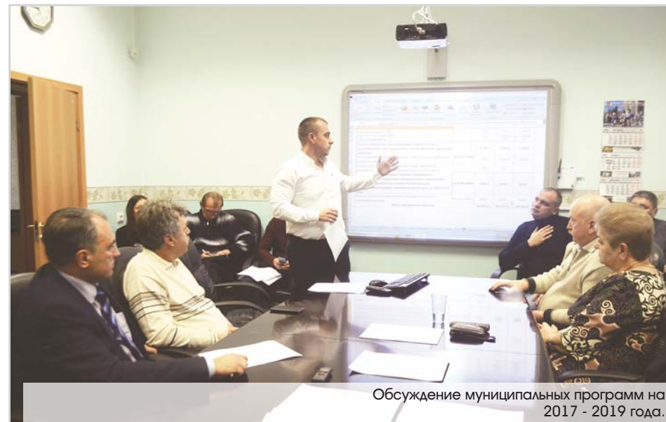
Обсуждение муниципальных программ на 2017 - 2019 года.