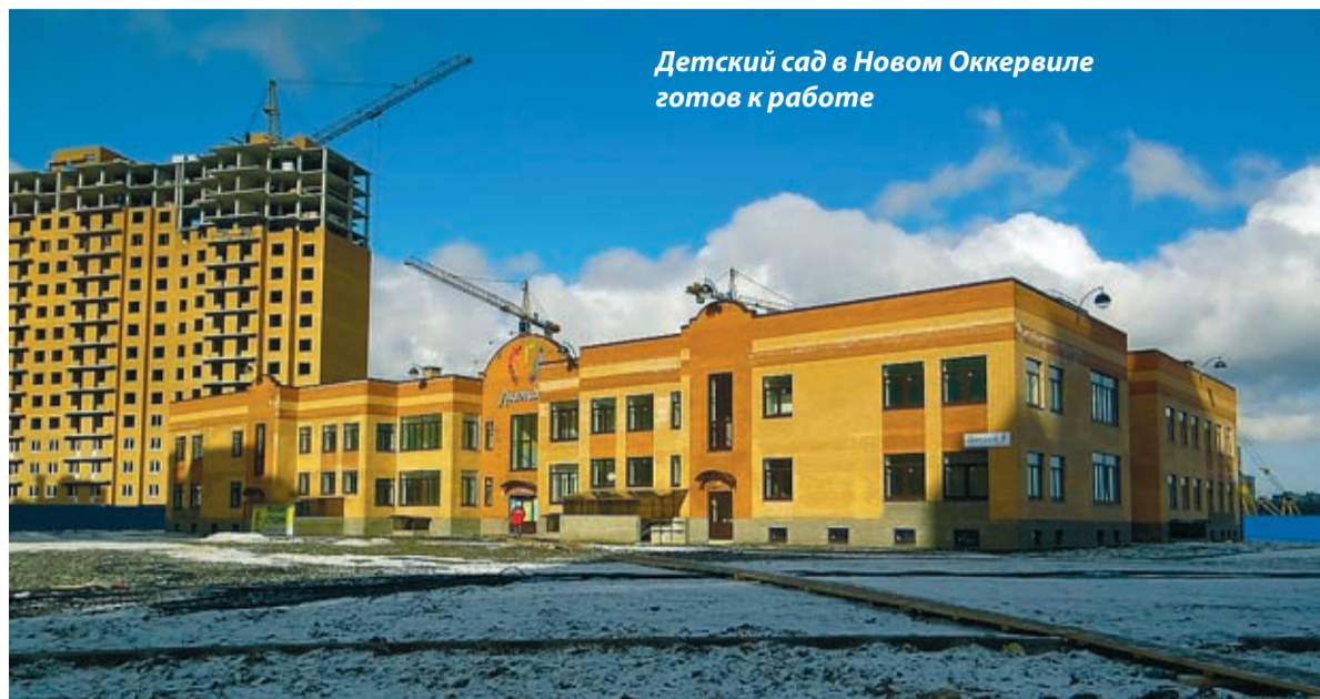
Детский сад в Новом Оккервиле готов к работе

ральных законов или могут принять необходимый областной закон для разрешения проблемы.