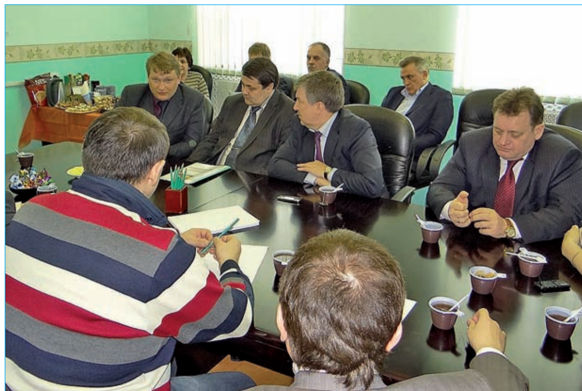
Осмотр новостройки Кудрово, комиссия депутатов Законодательного собрания Ленинградской области продолжила работу в зале заседаний администрации МО «Заневское сельское поселение»

Но раз сюда приехали депутаты и председатель Законодательного Собрания, будем надеяться, что вопрос будут решать и более высокие уровни власти – в порядке реализации федеральных и областных программ.