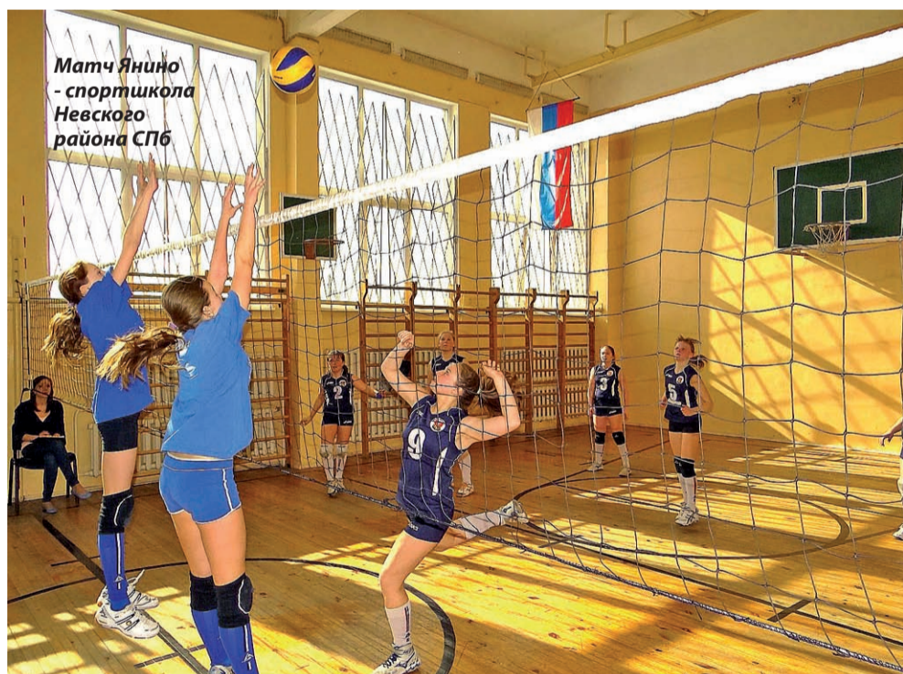
Матч Янино - спортшкола Невского района СПб

Команда Янино в упорной борьбе заняла 4-е место.