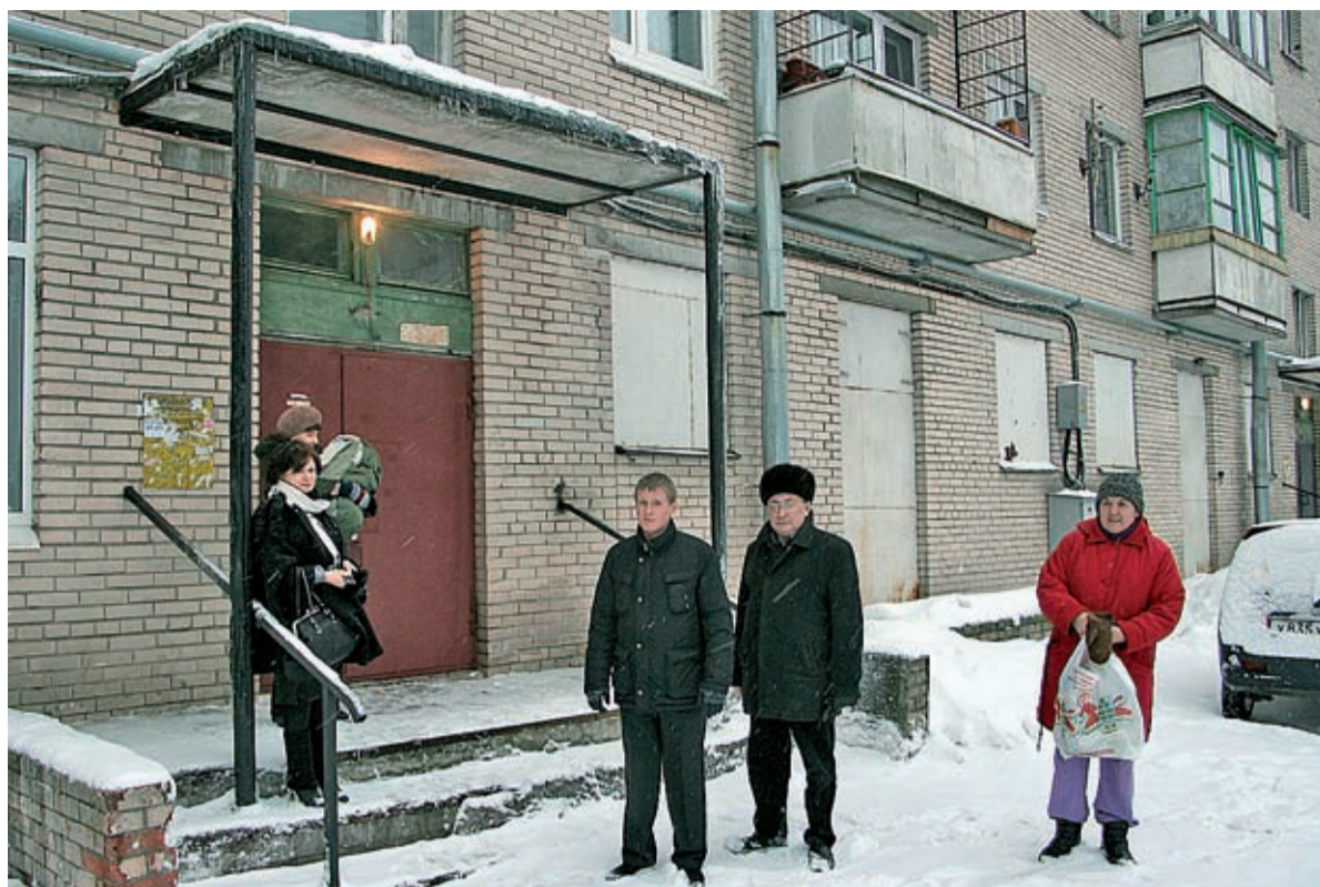
У всех подъездов 48-го дома в Заневке управляющая компания «ПЖКХ Янино» укрепила козырьки и оборудовала перила

На основании протокола замера сопротивления изоляции мы приняли решение поставить на общем собрании жильцов вопрос о замене проводки в доме. Мы предложим заменить электрооборудование, которое является общей собственностью – то, что «до счётчика». Замена про-