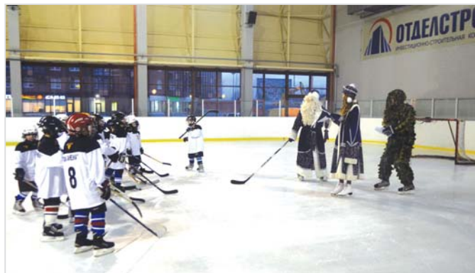
конце интерактивного спектакля Дедушка Мороз вручил мальчишкам подарки: сладкие сюр-

По сценарию Леший с Бабой-Ягой строят козни Деду Морозу и детворе. Чтобы вернуть украденный лесной бандой мешок с подарками, мальчишкам предстояло успешно преодолеть все препятствия, выполняя те или иные хоккейные элементы. Каждый из юных хоккеистов старательно демонстрировал свои навыки. В